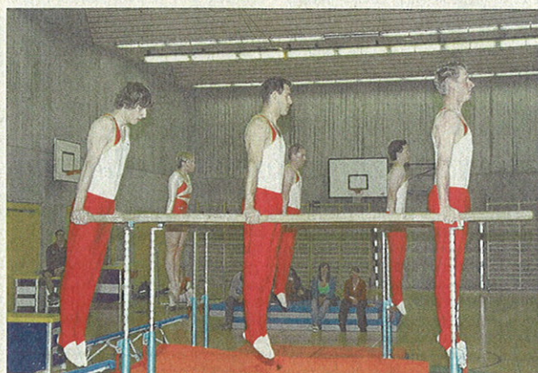
Der Barren zählt zu den Königsdisziplinen der Turner des Bülacher Turnvereins und verlangt den Athleten alles ab.