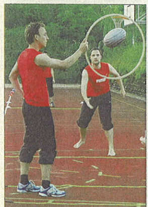
Sportler des TV Bülach üben die Disziplin «Fachtest Allround».