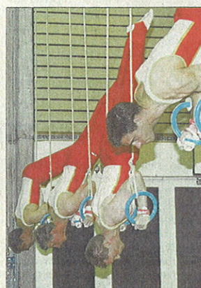
Geballte Kraft an den Schaukelringen zeigen Turner des TV Bülach.