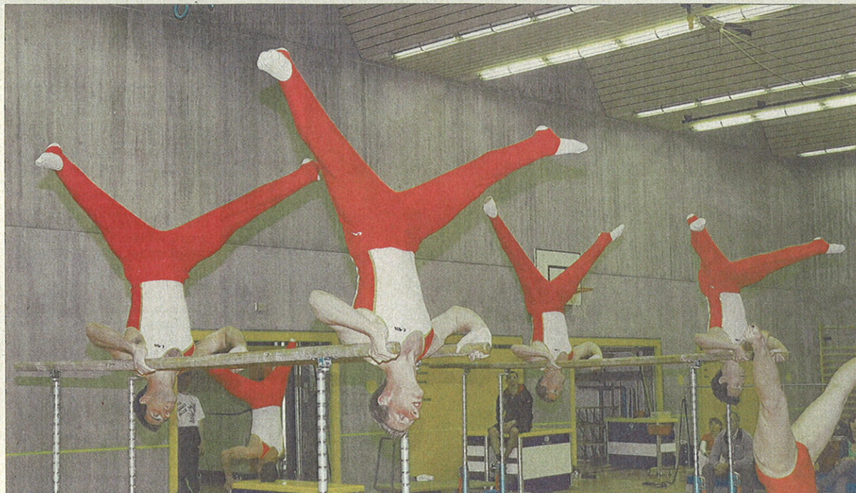
Synchron und mit viel Kraft: Die Turnerinnen und Turner des TV Bülach zeigen ihr «Meisterprogramm» am Barren. (fom)

Bern. In einem Gasthof in Bern g... letzten Montag ein 17-jähriger Russe angeblich «Student», auf seine Begleiterin gleichen Alters und gleicher Nationalität mehrere Schüsse ab und schoss sich dann selbst. Das Fräulein ist schwer verwundet und wird kaum mit dem Leben davonkommen. Bei den Personen sind Kinder reicher Eltern und hatten ein Liebesverhältnis, wofür aber die Eltern des Fräuleins nicht leiden mochten.